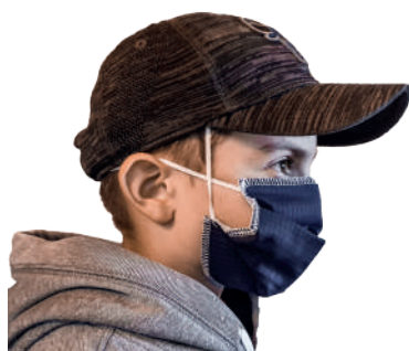
MASQUE ENFANT (4-8 ans)